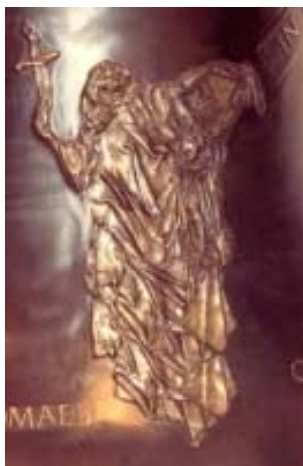
Reliéf sv. Bartoloměje, zdobící zvon toho jména ulitý r. 2000.