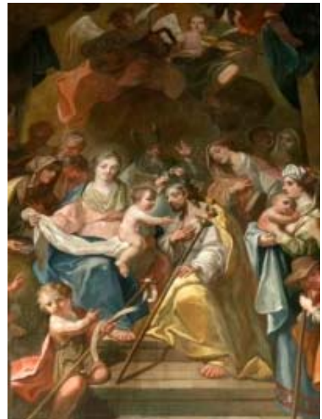
Výřez obrazu Příbuzenstva Kristova. Juda Tadeáš Super, 1771, olej na plátně. Vedlejší oltář Příbuzenstva Páně, kostel sv. Bartoloměje.