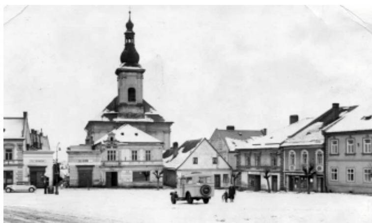
40. léta. Domy před kostelem byly později zbořeny. Farní archiv Zábřeh.

Historie kostela sv. Bartoloměje je úzce svázána z dějinami města Zábřeha, které bylo založeno v polovině 13. století. Kolonizační původ města je patrný z urbanistického členění dnešního historického centra. Jedna z ulic vybíhající z náměstí obklopeného měšťanskými domy vedla ke kostelu s menším prostranstvím, vedle kterého byl hřbitov. V roce 1351 se poprvé připomíná zábřežská farnost a kostel tedy v té době s jistotou sloužil jako farní. Představu o původní podobě kostela si můžeme vytvořit na základě dobových vyobrazení. Jen schematicky je chrám zachycen na vedutě města z roku 1623, na hřebeni střechy je patrná sanktusová vížka. Podrobněji je stavba zdokumentována na vedutě z roku 1727, kde je zachycena svatyně s polygonálním gotickým presbytářem prolomeným vysokými okny. Širší loď, která na presbytář navazuje na západní straně, byla pravděpodobně přistavěna v souvislosti s pozdějším rozšiřováním chrámu. Sanktusník umístěný na hřebeni střechy umožňoval zavěšení jen menších zvonů, větší zvony, kterými chrám v té době disponoval, byly zavěšeny na samostatně stojící zvonici.