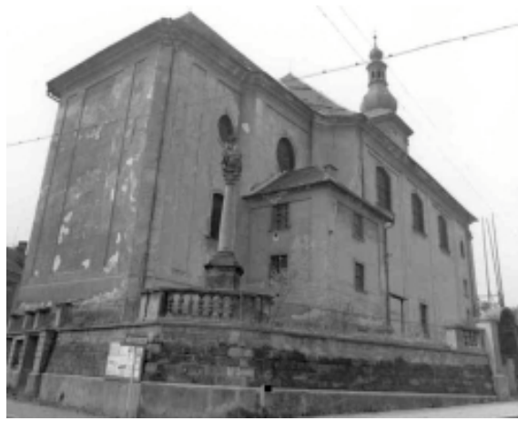
Kostel před opravou v roce 1972.