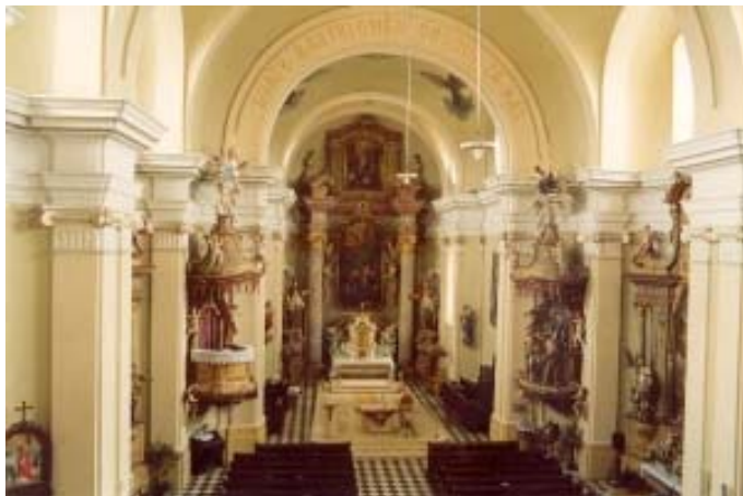
Interiér kostela sv. Bartoloměje.