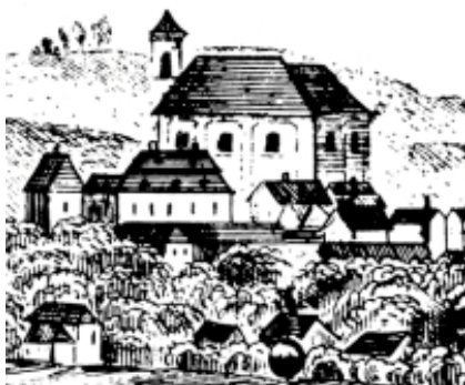
1845 výřez veduty

Historie kostela sv. Bartoloměje je úzce svázána z dějinami města Zábřeha, které bylo založeno v polovině 13. století. Kolonizační původ města je patrný z urbanistického členění dnešního historického centra. Jedna z ulic vybíhající z náměstí obklopeného měšťanskými domy vedla ke kostelu s menším prostranstvím, vedle kterého byl hřbitov. V roce 1351 se poprvé připomíná zábřežská farnost a kostel tedy v té době s jistotou sloužil jako farní. Představu o původní podobě kostela si můžeme vytvořit na základě dobových vyobrazení. Jen schematicky je chrám zachycen na vedutě města z roku 1623, na hřebeni střechy je patrná sanktusová vížka. Podrobněji je stavba zdokumentována na vedutě z roku 1727, kde je zachycena svatyně s polygonálním gotickým presbytářem prolomeným vysokými okny. Širší loď, která na presbytář navazuje na západní straně, byla pravděpodobně přistavěna v souvislosti s pozdějším rozšiřováním chrámu. Sanktusník umístěný na hřebeni střechy umožňoval zavěšení jen menších zvonů, větší zvony, kterými chrám v té době disponoval, byly zavěšeny na samostatně stojící zvonici.