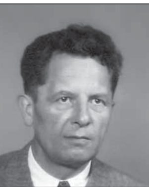
Josef Hubálek (1904 – 1984).

Není mnoho vlastivědných sborníků, které by se dožily padesátky. Severní Moravě se to podařilo díky nadšení a obětavosti vlastivědných pracovníků a později zásluhou redakčního týmu, jehož přičiněním sborník pravidelně, od roku 1972 dvakrát ročně, vycházel.