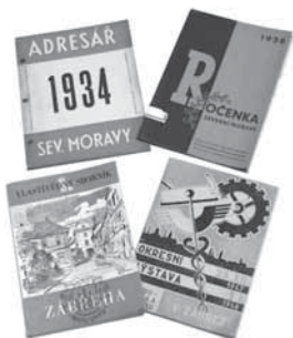
Ročenky které, vydávala ve 30. letech 20. století Společenská knihtiskárna v Zábřehu.

V padesátých letech se však se silící touhou po vlastním vlastivědném sborníku zejména na Zábřežsku setkáváme