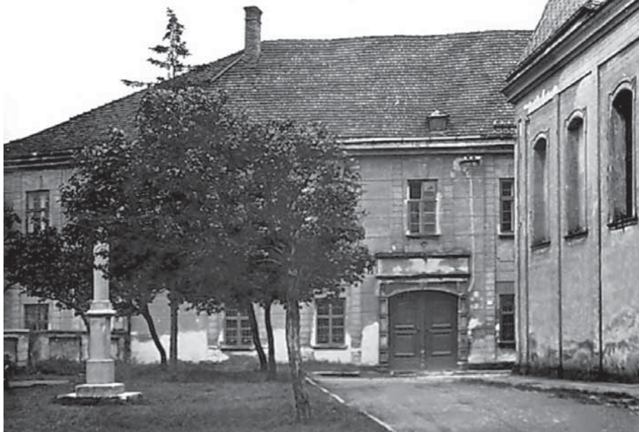
Budova mohelnického muzea kolem roku 1960.