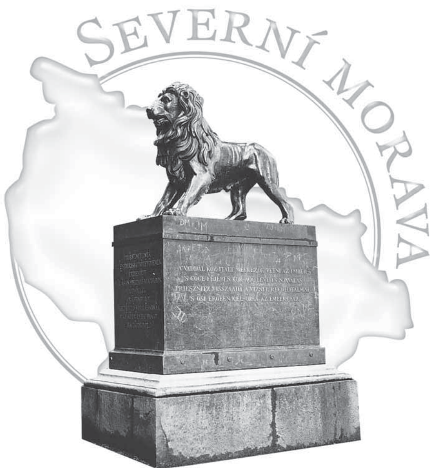
Maďarský pomník postavený k počť V. Priessnitzu na Gräfenberku, dílo L. Schwanthalera z roku 1939.