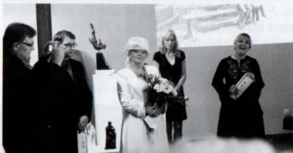
Z vernisáže výstavy 7. května 2009 v Galerii Šumberska.